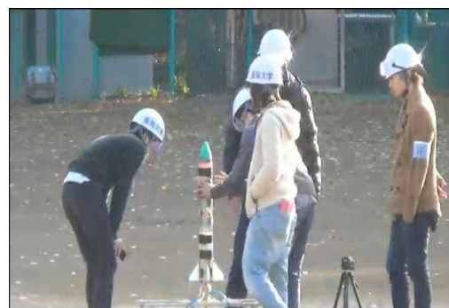
▲昨年度の競技大会の様子