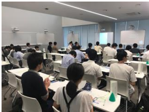
▲9月に実施された説明会の様子