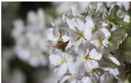
【昨年のライトアップの様子】

東海大学〔熊本キャンパス〕（所在地：熊本市東区渡鹿 9-1-1、学長：山田 清志〔やまだ きよし〕）チャレンジセンターの学生プロジェクト「先端技術コミュニティ アコット ACOT（以下、ACOT）」では、3月22日（木）～4月上旬の19：00頃から22：00まで、太陽光発電を電源に、LED 投光器でキャンパス内の桜の木をライトアップする「夜桜 ECO ライトアップ」を開催いたします。期間中はキャンパスを開放し、一般の方も構内でお花見を楽しんでいただけます。また構内の桜は、JR 豊肥本線「東海学園前」駅のホームや電車の車窓からもお楽しみいただけます。