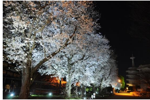
▲「夜桜 ECO ライトアップ」の様子（2018年）

この催しは、太陽光など自然の力を利用した「グリーンエネルギー」で緊急時の非常用電源を確保しようと、「ACOT」の学生たちが中心となって行っている取り組みの一環であり、2012年から桜の開花時期に毎年開催しているものです。今では、この時期の恒例イベントとして、地域の皆さまにもご好評をいただいています。8回目を迎える今年は、ソーラーパネル14台、LED投光器約40器を使用して、構内のJR 豊肥本線沿いに並ぶソメイヨシノ約15本を照らし、春の闇夜に咲き誇る桜を幻想的に演出します。