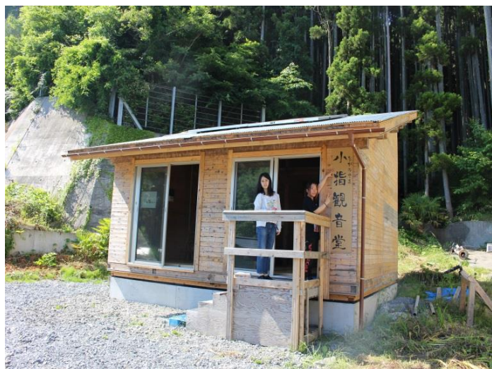
▲ウッドデッキ設置前の小指観音堂

東日本大震災が発生した2011年から、宮城県石巻市北上町十三浜相川・小指地区や岩手県大船渡市三陸町越喜来泊地区において公民館などの建設を行うほか、子どもたちを対象にした「電子工作教室」や、学内の他プロジェクトとの共催によるチャリティコンサートなど、さまざまな支援活動を継続的に実施。2013年には、大船渡市三陸町越喜来泊地区で本学、芝浦工業大学、NPO 法人アーバンデザイン研究体などが協力して、津波で流失した世帯それぞれの敷地に追憶のモニュメントを設置する交流型イベント「とまりに花を咲かせましょー未来へ繋げる 夏の泊の縁づくり」も開催。また2014年8月からは、海岸線の津波到達ラインから高台に通じる経路に、低地・高台双方の住民に利用してもらうための新規遊歩道「結の道」の建設をスタートしている。