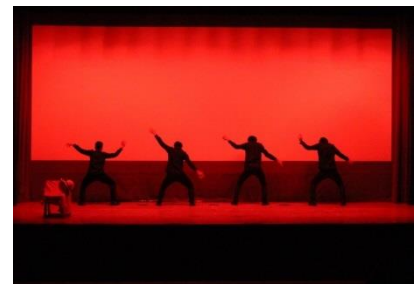
▲DAN DAN DANCE &amp; SPORTS プロジェクトの過去の活動、練習風景