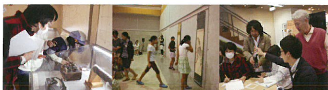
ひらめきとともきサイエンス(2014年度)の会場風景