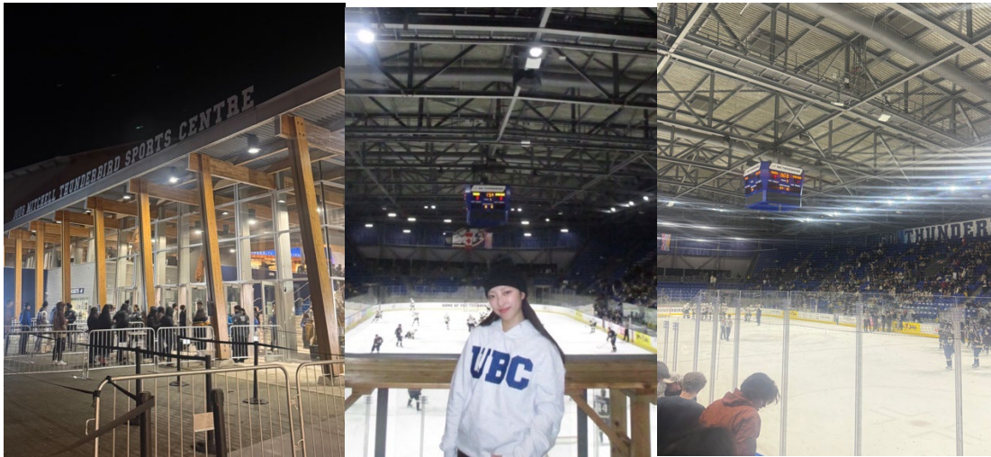
→ UBC のアイスホッケー観戦