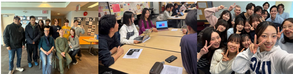
→ コース終了後先生とクラスメイトとの写真・授業中プレゼンの様子