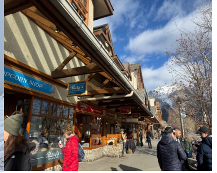
→ 3泊4日 Rocky mountain tour(バスツアー)