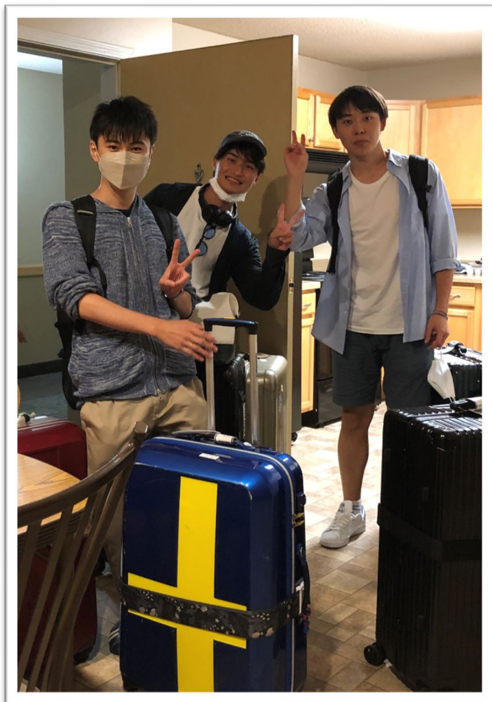
思ったより綺麗な部屋だったそうです。