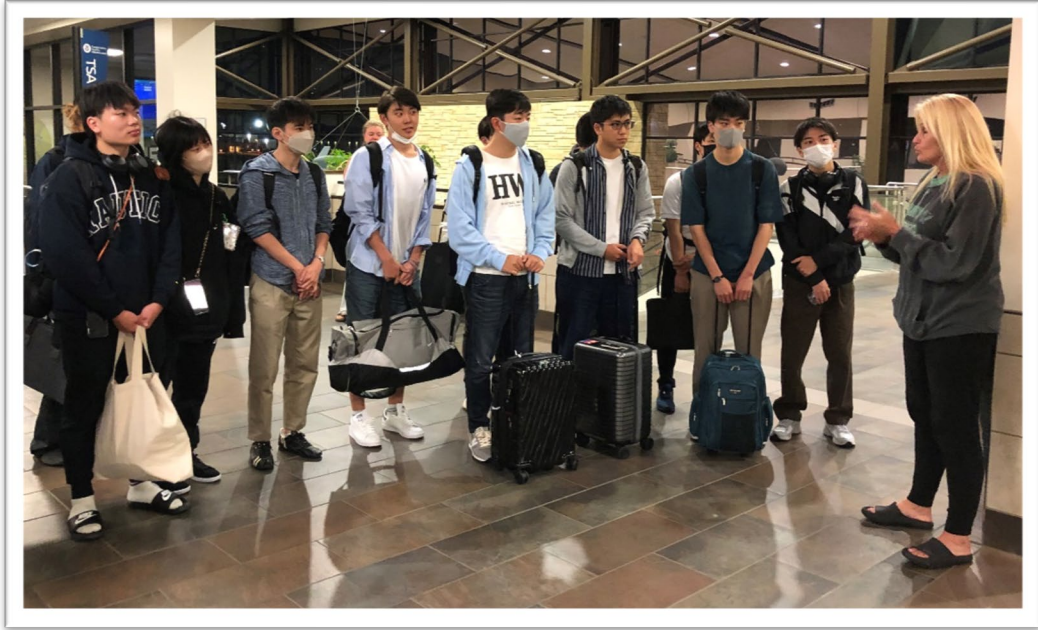
Debbieさんから挨拶、アパートまではUNDスタッフが送ってくれます。