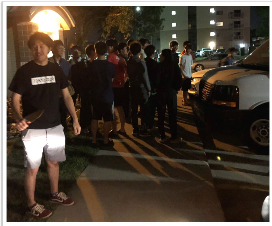
アパートでは先輩達が出迎えてくれました。