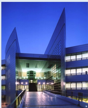
植草学園大学L棟 (ビッグリーフ)

There are various types of architecture for human life, and my laboratory is conducting basic and applied research on architectural planning and design mainly for public facilities. The first purpose of architectural planning research is to regulate the conditions, that is the programs (scale, function, spatial composition) necessary for the design of various buildings. The second purpose is to grasp, evaluate, and diagnose problems or issues of usage for users and managers after designing, and to obtain new architectural planning and design guidelines based on them. Recent research is on various public buildings such as school education facilities (kindergartens, elementary, junior high, high schools, universities), libraries, art galleries, museums, welfare facilities (elderly, childcare, child-rearing support), government buildings, etc. Practice of architectural planning and design activities can be mentioned. Now that we have entered an era of full-scale population decline, we are also working on research related to the reorganization of all public facilities in collaboration with neighboring local governments from the perspective of wide-area urban and regional planning.