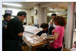
スタディモデル ワークショップ