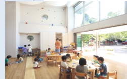
園児の保育活動調査 (竣工後)