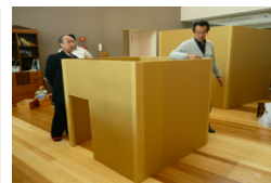
小空間モデル (デン) 設置実験