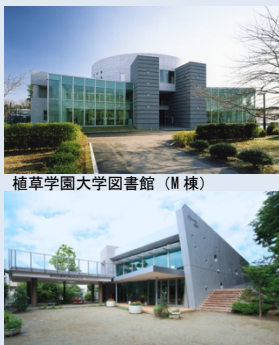
植草学園大学図書館 (M棟)