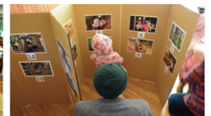
園児の遊び環境の嗜好評価実験 (竣工前)