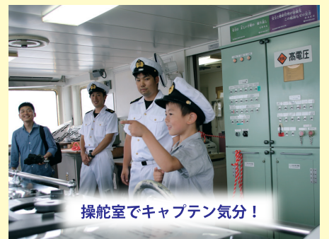
操舵室でキャプテン気分!