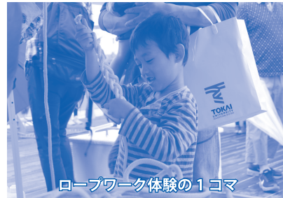
ロープワーク体験の1コマ