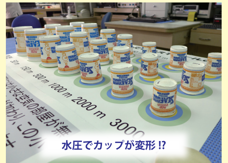
水圧でカップが変形!?